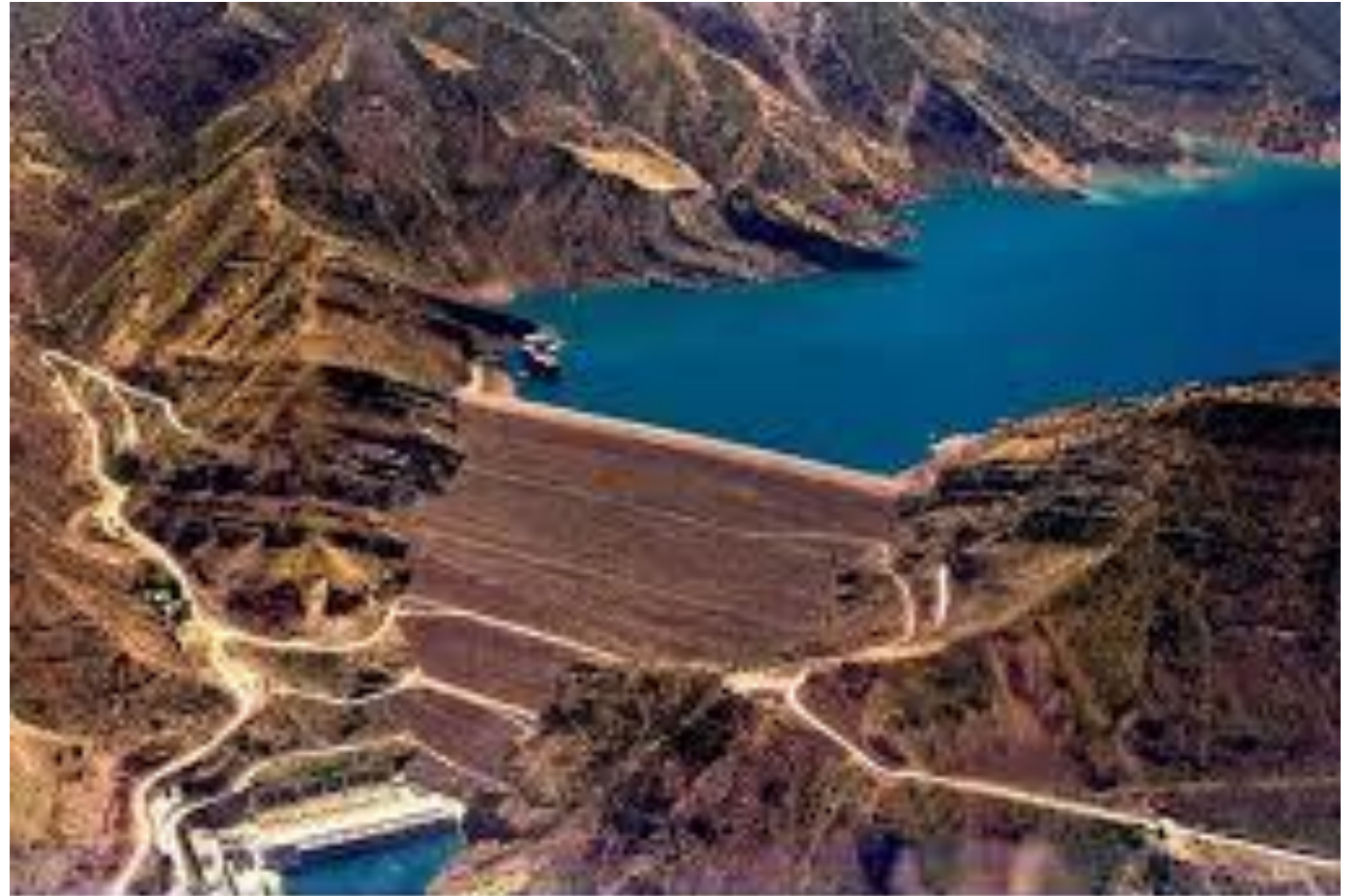
Нурекская ГЭС на р.Вакан у г.Нурек Таджикской ССР - самая высокая насыщенная плотина в мире (306м)